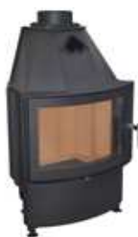
CHOPOK R550, LD