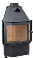
CHOPOK P, LD